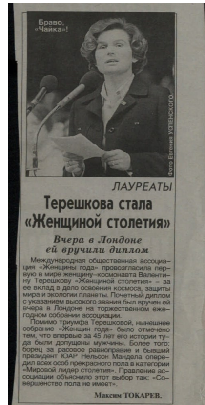
Токарев, М. Терешкова стала "Женщиной столетия": Вчера в Лондоне ей вручили диплом / М. Токарев; фото Евгения Успенского. – (Лауреаты). – №...(12 октября). – 2000. (доступно в ЭЧЗ ПБ)