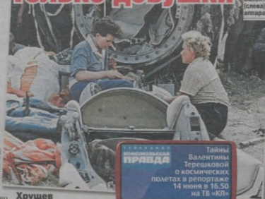
Татьяна Валентиновна Терешкова О космических полетах в 16.50 на ТВ «КП

С политической точки зрения выбор стран и континентов для приветствия был очень предусмотрительный - разное между было так обобщено? Например, разве