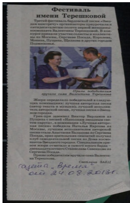
Заец, С. Фестиваль имени Терешковой / С. Заец // Время. – №...(24 августа). – 2013. (доступно в ЭЧЗ ПБ)