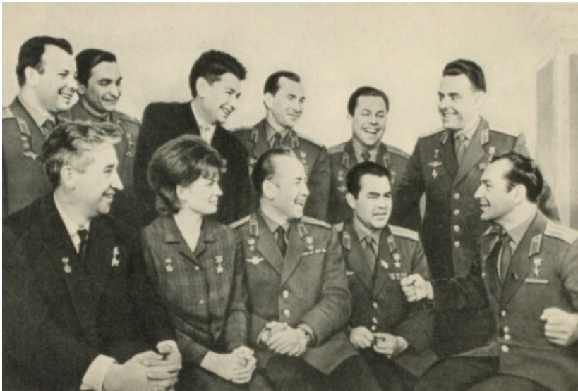
Герои Советского Союза летчики-космонавты СССР [Изоматериал : электронный ресурс] : [открытка] / фото А. Устинова. – (Санкт-Петербург: Президентская библиотека имени Б. Н. Ельцина, 2015).

Окончательный выбор претендентки сделал сам глава правительства Н. С. Хрущев. Полёт женщины-космонавта состоялся 16 июня 1963 г. в 12 часов 30 минут по московскому времени. На орбиту спутника Земли был выведен космический корабль «Восток-6», впервые в мире пилотируемый женщиной – гражданкой Советского Союза космонавтом Терешковой Валентиной Владимировной, позывной «Чайка». Целью полета являлись дальнейшие медико-биологические исследования, касающиеся влияния космической среды на работу организма человека в непривычных для него условиях. Запуск в космос женщины давал возможность провести эксперимент, в ходе которого сравнивались бы воздействия условий орбитального полета на мужской и женский организм.