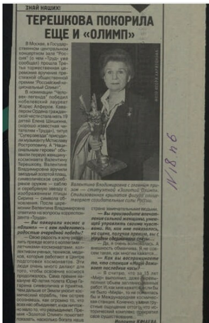
Карачаева, И. Терешкова покорила еще и "Олимп" / И. Карачаева. – №...(23 марта) / Качаева, И. – 2001. (доступно в ЭЧЗ ПБ)