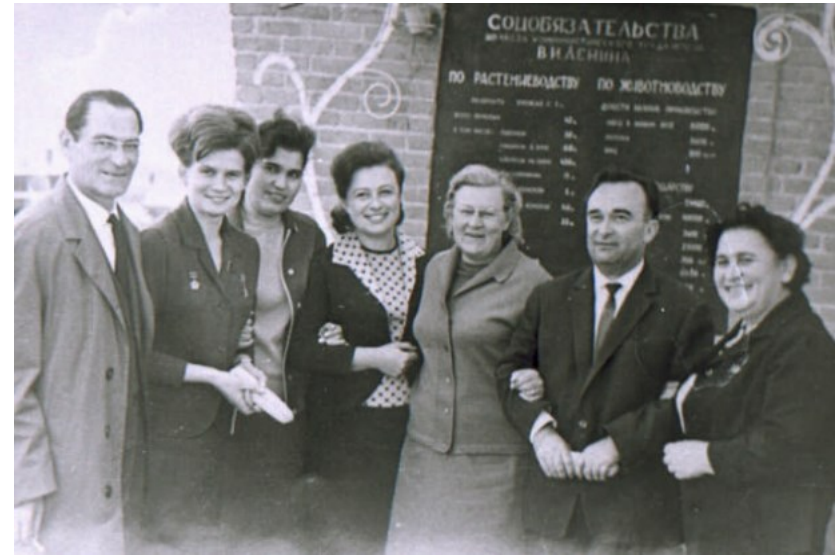
Первая женщина-космонавт Валентина Терешкова в Кабардино-Балкарии. с. Аргудан, Урванский район. 5 октября 1966 г. : [фотография]. – 5 октября 1966. – Фотопечать, черно-белая.